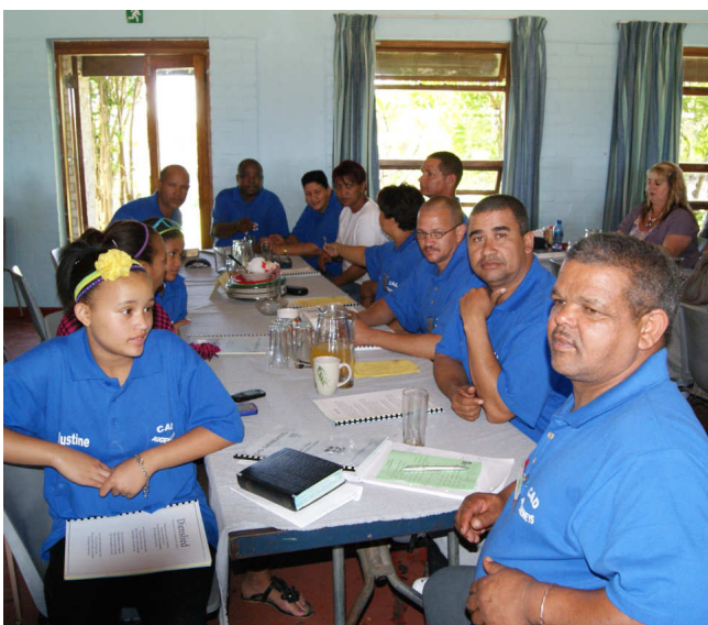
Nuwe CAD groep: Aggeneys